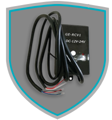
FOTOCELDAS DE SEGURIDAD